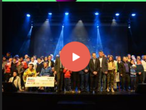
LAURIERS DU SPORT 2020 EN VIDÉO