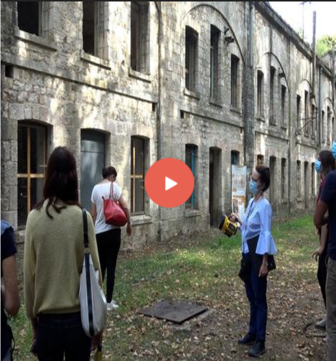
LE FORT DE VANCIA D'HIER À AUJOURD'HUI