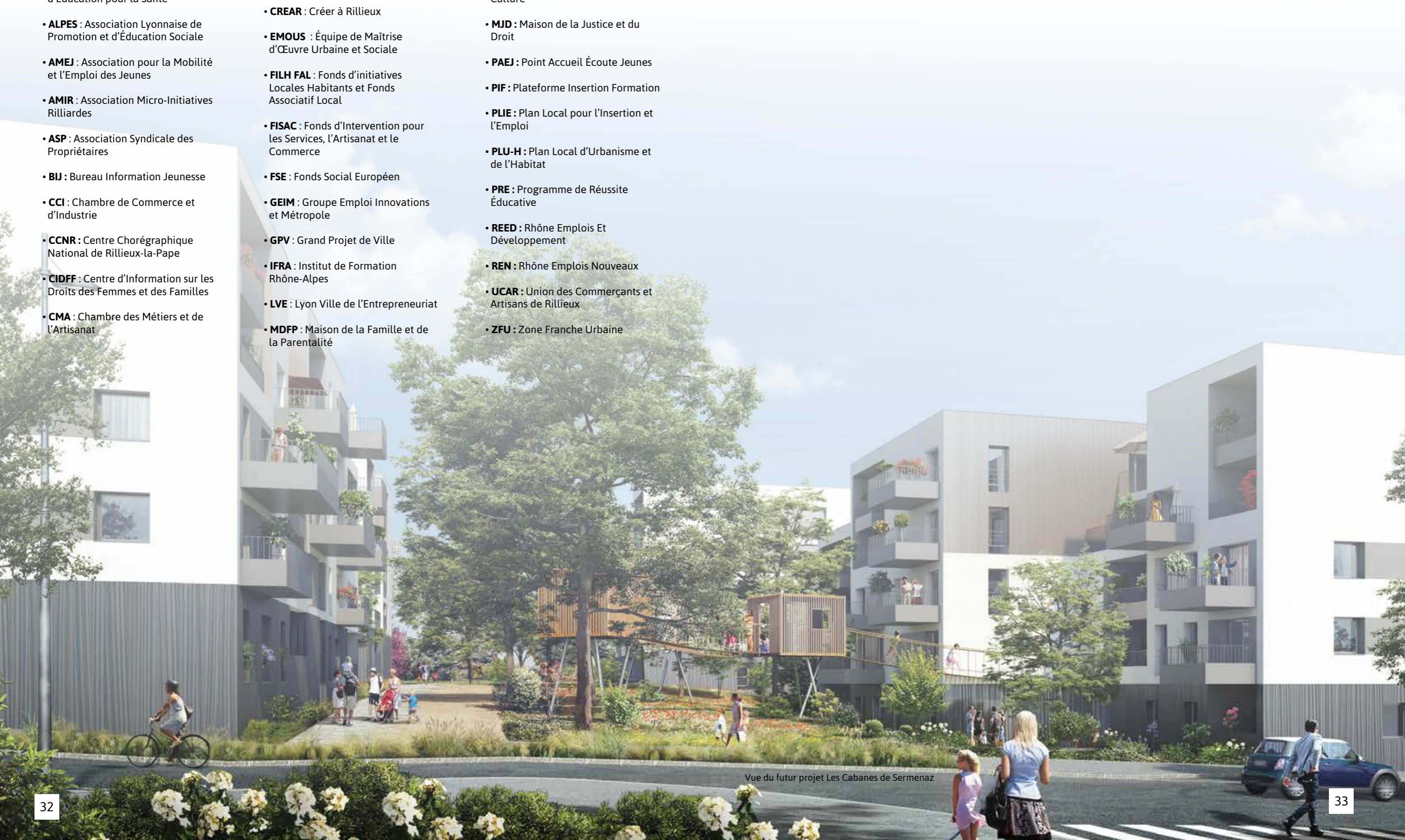
Vue du futur projet Les Cabanes de Sermenaz