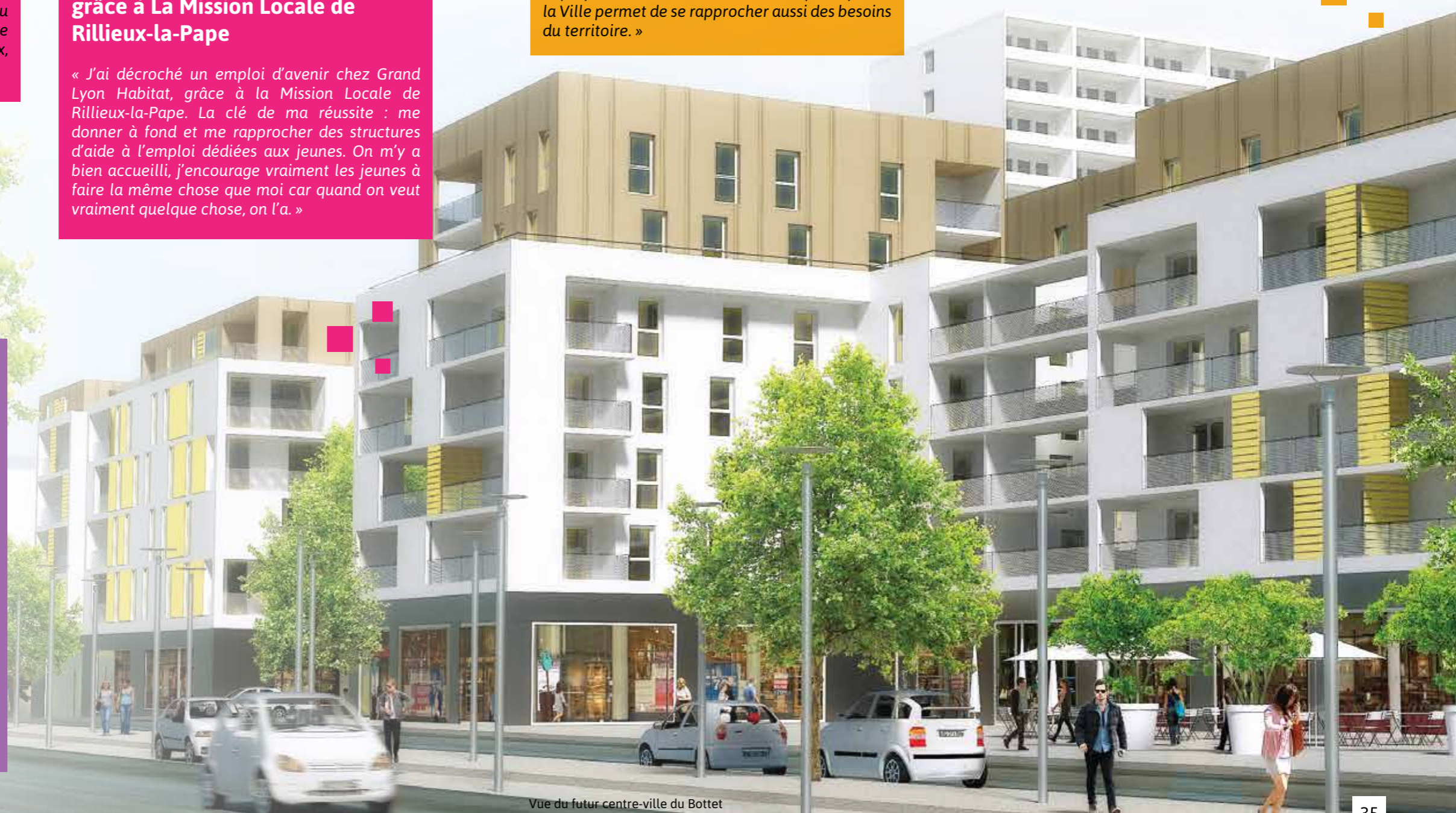
Vue du futur centre-ville du Bottet

« Je me suis impliquée dans ces réunions car je connais Rillieux depuis longtemps et j'étais curieuse de voir son évolution et de donner mon avis sur des projets constructifs à mettre en place. Au fur et à mesure des Conseils Citoyens, j'étais de plus en plus intéressée par le devenir de Rillieux et assez agréablement surprise de toutes les actions de modernisation prévues pour rendre cette ville plus attrayante et agréable à vivre. Sa situation géographique en fait une ville pleine d'attrait (Ville verte, possibilité d'extension des commerces, proximité avec Lyon, accès routiers, etc.). »