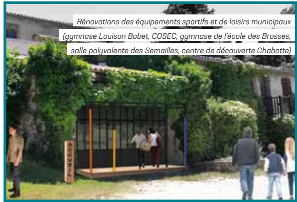
Rénovations des équipements sportifs et de loisirs municipaux (gymnase Louison Bobet, COSEC, gymnase de l'école des Brosses, salle polyvalente des Semailles, centre de découverte Chabotte)