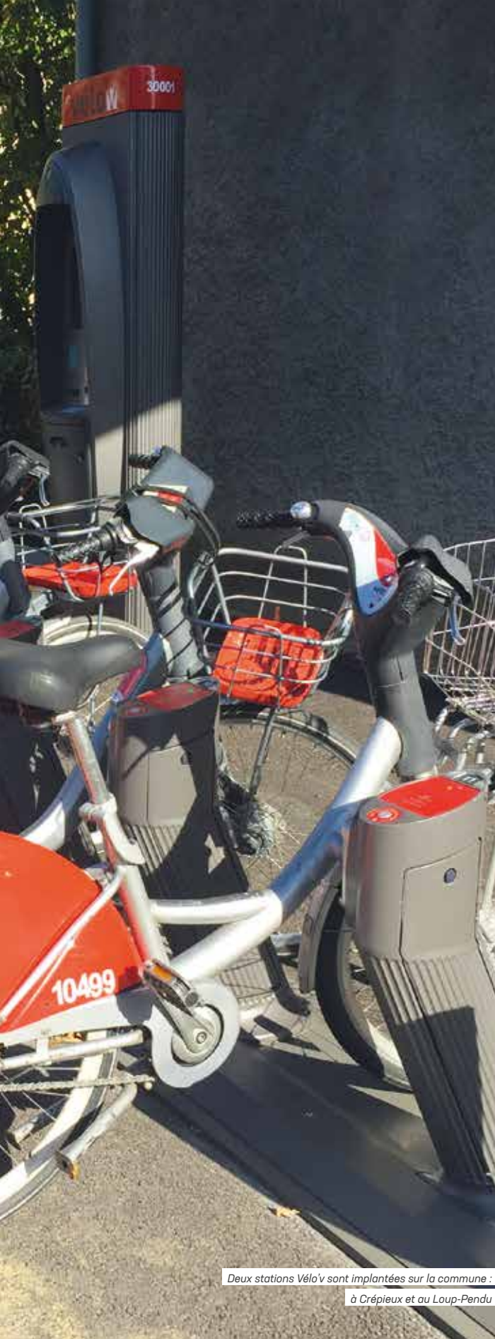
Deux stations Vélo'v sont implantées sur la commune : à Crépieux et au Loup-Pendu