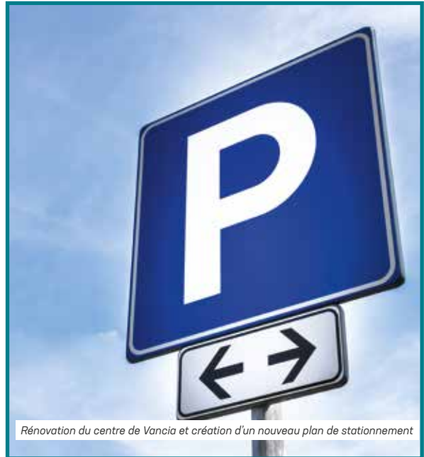
Rénovation du centre de Vancia et création d'un nouveau plan de stationnement