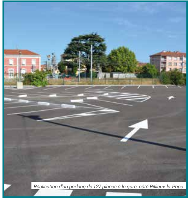
Réalisation d'un parking de 127 places à la gare, côté Rillieux-la-Pape