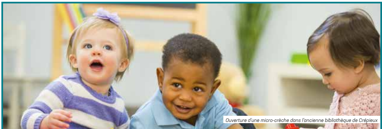
Ouverture d'une micro-crèche dans l'ancienne bibliothèque de Crépieux