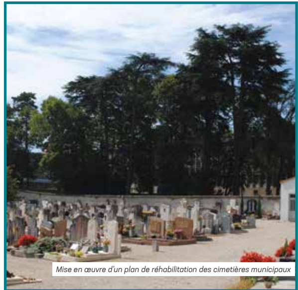
Mise en œuvre d'un plan de réhabilitation des cimetières municipaux