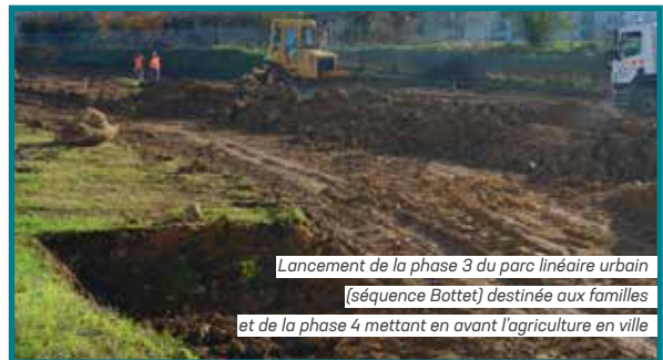
Lancement de la phase 3 du parc linéaire urbain (séquence Bottet) destinée aux familles et de la phase 4 mettant en avant l'agriculture en ville