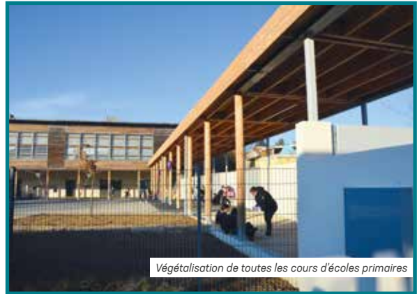
Végétalisation de toutes les cours d'écoles primaires