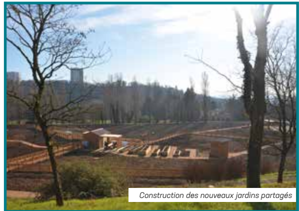
Construction des nouveaux jardins partagés