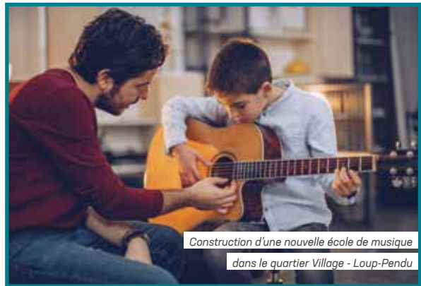
Construction d'une nouvelle école de musique dans le quartier Village - Loup-Pendu