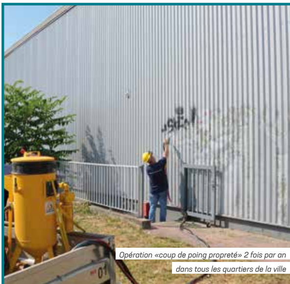
Opération «coup de poing propreté» 2 fois par an dans tous les quartiers de la ville

→ Pour instruire et délivrer les permis de construire, la municipalité se basera désormais sur une «Charte de l'habitat durable» qu'elle rédigera elle-même. Une manière de bâtir plus responsable et de limiter la densification urbaine.