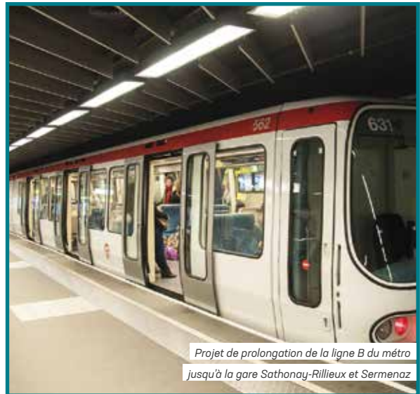
Projet de prolongation de la ligne B du métro jusqu'à la gare Sathonay-Rillieux et Sermenaz