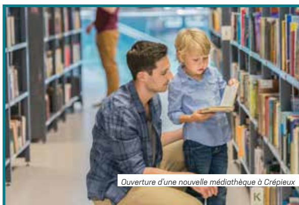
Ouverture d'une nouvelle médiathèque à Crépieux

→ Soucieuse de développer les équipements sportifs pour permettre la pratique au plus grand nombre, la Ville a pour objectif de construire un nouveau gymnase sur le secteur de Vancia.