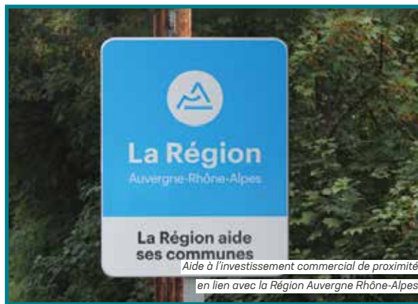
Aide à l'investissement commercial de proximité en lien avec la Région Auvergne Rhône-Alpes