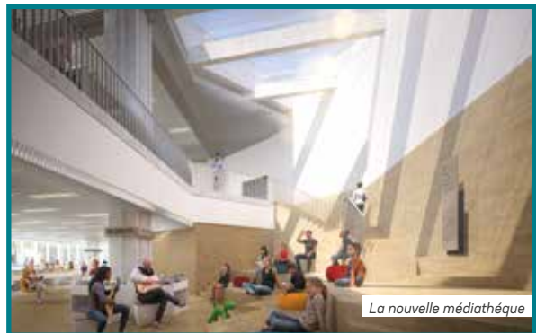
La nouvelle médiathèque