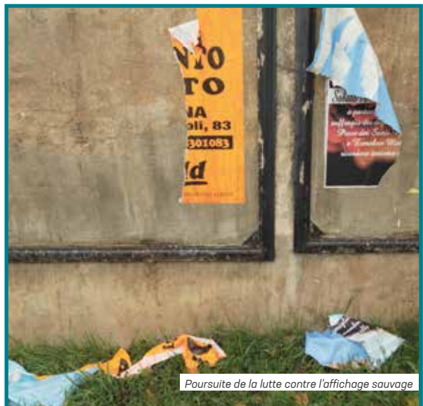
Poursuite de la lutte contre l'affichage sauvage