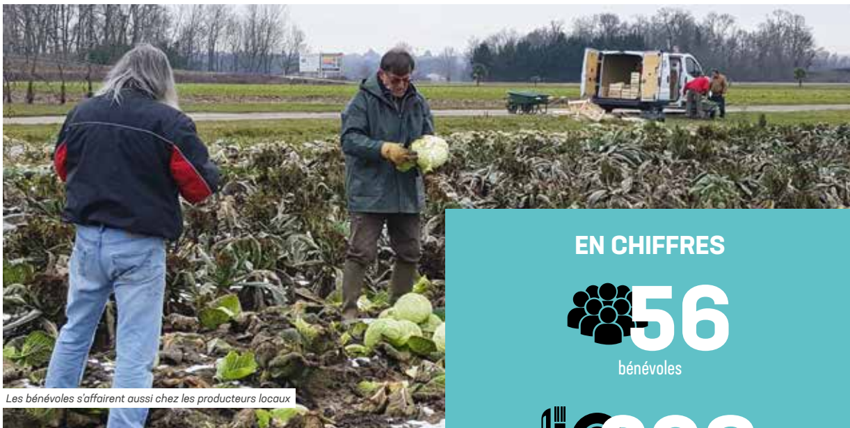
Les bénévoles s'affairent aussi chez les producteurs locaux

COMME CHAQUE HIVER, DEPUIS MAINTENANT 30 ANS, LES BÉNÉVOLES DES RESTOS DU CŒUR S'AFFAIRENT PARTOUT EN FRANCE POUR AIDER LES PLUS DÉMUNIS. AU CENTRE DE RILLIEUX-LA-PAPE, C'EST L'EFFERVESCENCE.