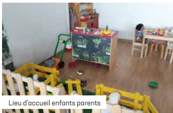
Lieu d'accueil enfants parents