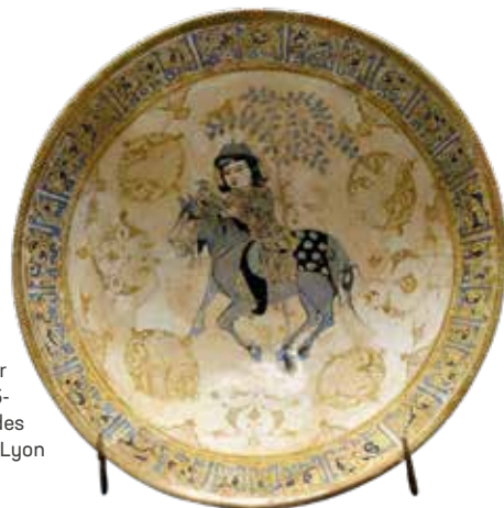
Coupe à décor cavalier, Iran, 1275- 1325 - Musée des Beaux-arts de Lyon