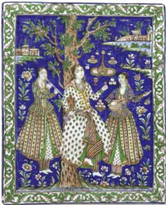
Trois musiciennes - Carreau de revêtement XVIII e siècle - XIX e siècle - Musée des Beaux-arts de Lyon

→ Reconnu "musée de France" par le ministère de la Culture et de la communication en 2011, ce musée est dédié à l'histoire naturelle et l'anthropologie des sociétés comme des civilisations. En digne héritier du musée Guimet de Lyon, il a ouvert ses portes en 2014 dans un bâtiment à l'architecture "déconstructiviste" qui attire d'emblée le regard de ceux qui arrivent ou quittent la ville. Son ambition ? Offrir une pédagogie distrayante et artistique, "les confluences des savoirs", une thématique naturelle pour ce musée situé au point de jonction de la Saône et du Rhône.