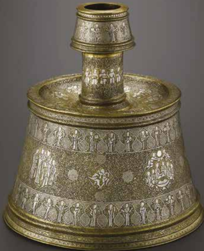
Chandelier aux scènes chrétiennes, 1248-1249 - Musée du Louvre