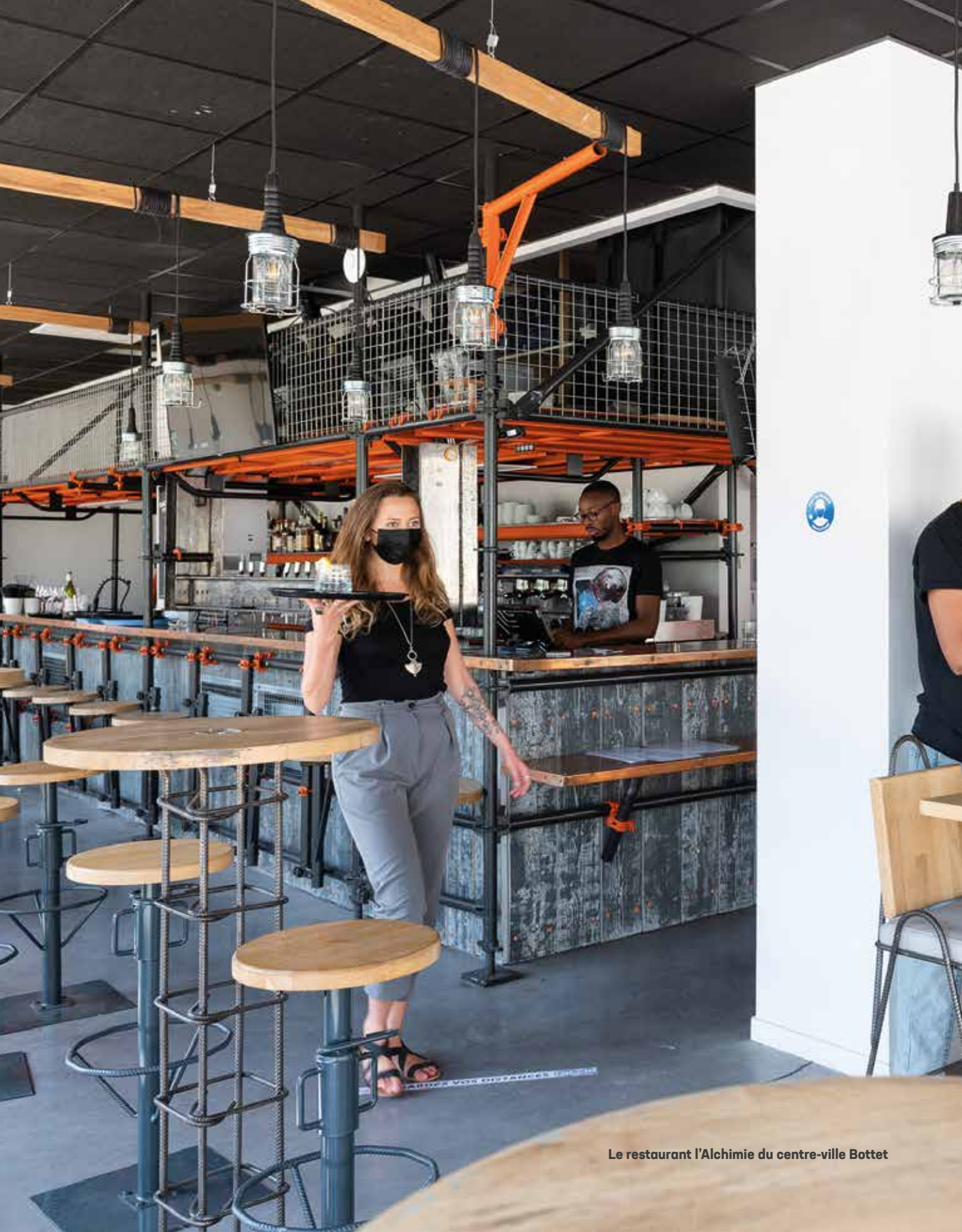
Le restaurant l'Alchimie du centre-ville Bottet