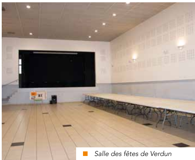
■ Salle des fêtes de Verdun