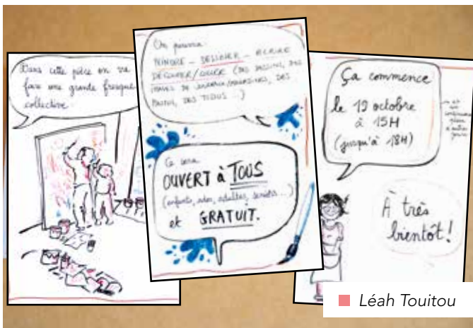
■ Léah Toutou