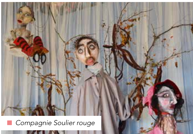
■ Compagnie Soulier rouge