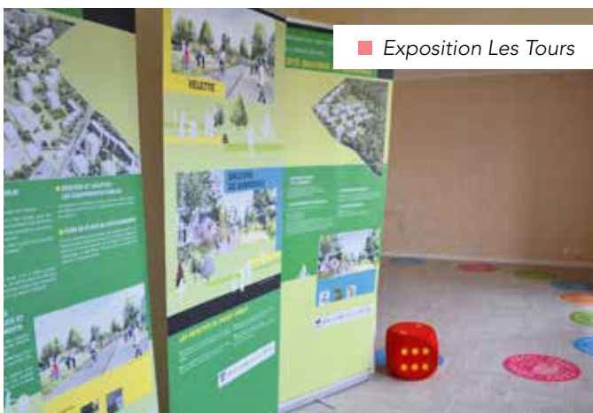
■ Exposition Les Tours