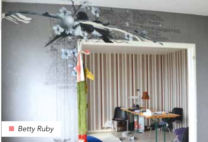
■ Betty Ruby

RENSEIGNEMENTS (VISITE, PARTICIPATION, HORAIRES...): GRAND PROJET DE VILLE - 04 37 85 00 63 TOUR N°1 - 4 E ÉTAGE, PLACE LYAUTEY