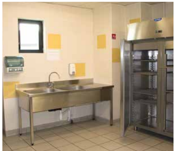
■ Un coin cuisine dans toutes les salles municipales