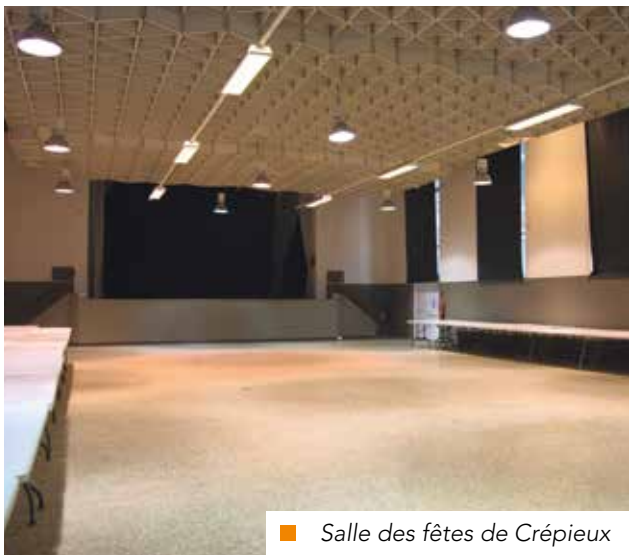
■ Salle des fêtes de Crépieux

RENSEIGNEMENTS ET RÉSERVATIONS - 04 78 55 31 26 OU 04 37 85 00 98 - VIEASSOCIATIVE@RILLIEUXLAPAPE.FR