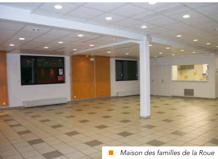
■ Maison des familles de la Roue

DIRECTION PROTOCOLE ET ÉVÉNEMENTS - 04 37 85 01 57