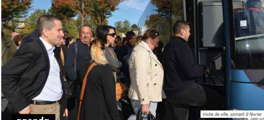
Visite de ville, samedi 9 février