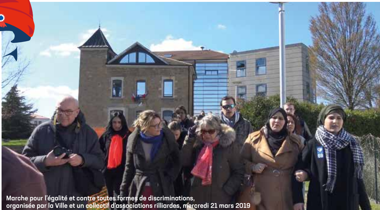
Marche pour l'égalité et contre toutes formes de discriminations, organisée par la Ville et un collectif d'associations riillandes, mercredi 21 mars 2019