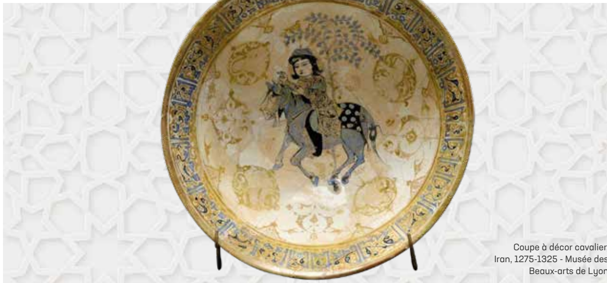
Coupe à décor cavalier, Iran, 1275-1325 - Musée des Beaux-arts de Lyon