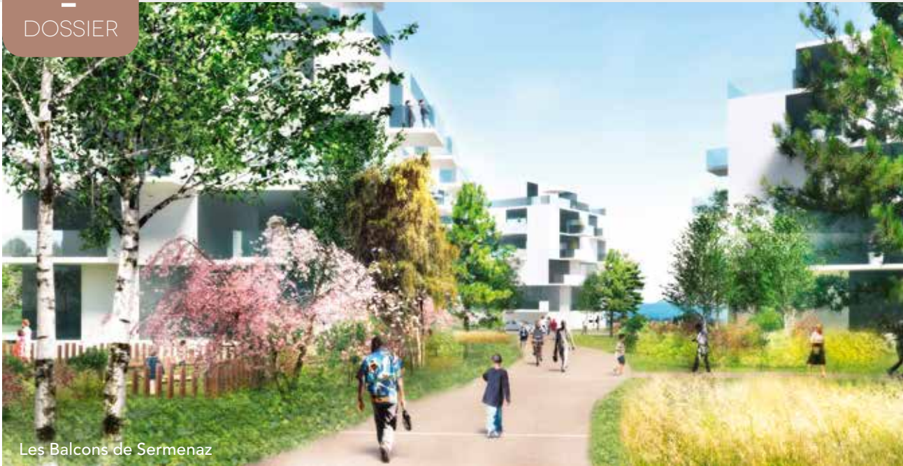
Les Balcons de Sermenaz