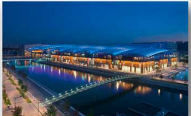
Pôle de Loisirs et Commerces - Concepteur : ACL