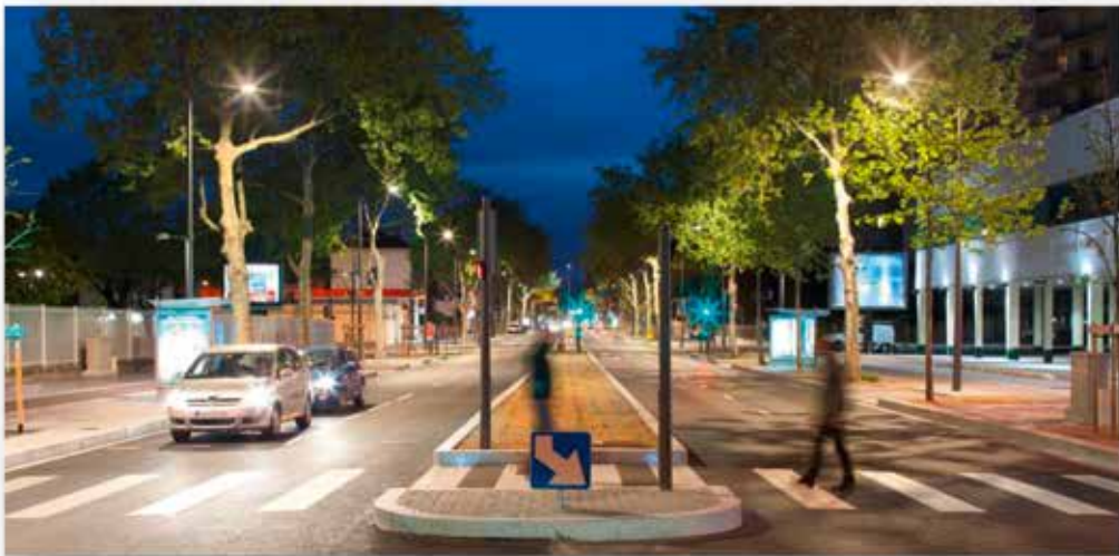
Avenue Mermoz à Lyon - Concepteur : COBALT LIGHTING DESIGN - Photo : Xavier BOYMOND

Eclairage Public - Eclairage Sportif - Mise en valeur - Maintenance - Signalisation Lumineuse Tricolore