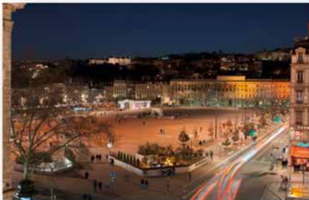
Place Bellecour à Lyon - Concepteur : LEA