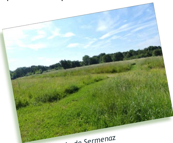
Prairie de Sermenaz