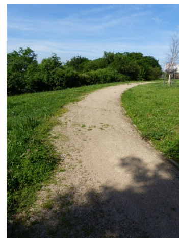
Parc des Horizons

Pour ce qui est des classes 3 et 4, la végétation sera tolérée sans toutefois qu'elle prenne de la hauteur. En classe 3, le passage correspond au passage des utilisateurs mais si toutefois la végétation envahit l'entièreté de la zone, il sera nécessaire de désherber. En classe 4, plus aucun désherbage ne sera réalisé. Les allées se dessineront au gré des passages fait par les utilisateurs du site.