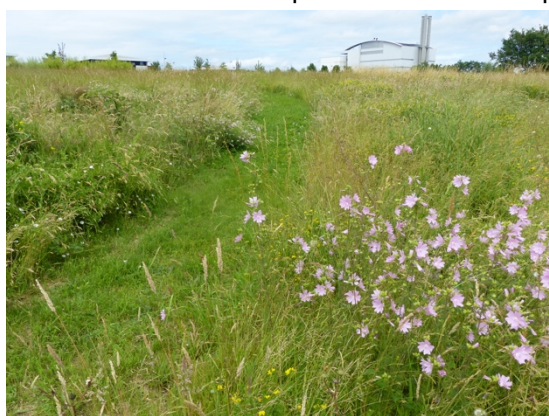
Prairie de Sermenaz

En classe 4, une fauche est réalisée afin de remplacer la tonte. Le but est de laisser, dans les vastes espaces moins fréquentés, la végétation spontanée et naturelle