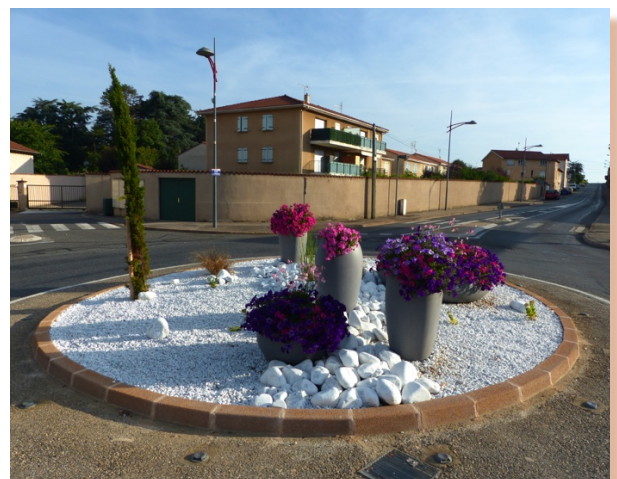
Rond-point Route de Strasbourg