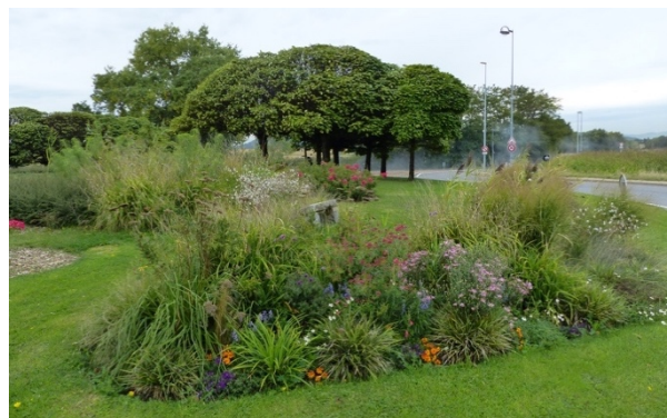
Rond-point de Vancia

Les jardins concernés à Rillieux : Le carrefour des Alagniers, le Parc des Horizons, Centre aéré des Lones (en partie), Parc Brosset (en partie), de la Roue, de l'école de Vancia, Rond-point de Vancia, de l'autoroute, Ostérode Mairie