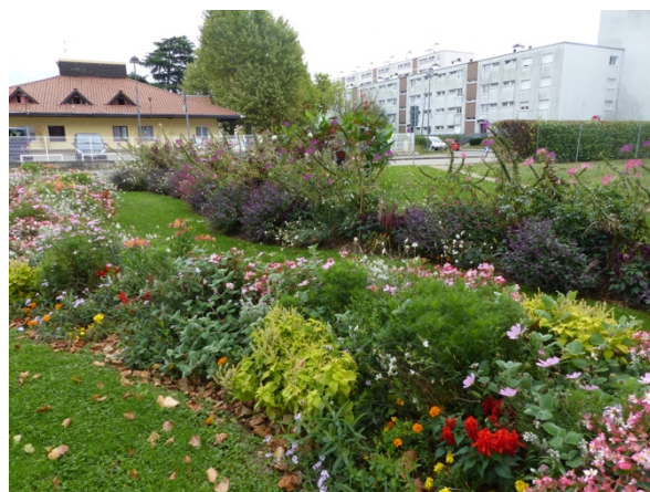
Massif Hôtel De Gaulle