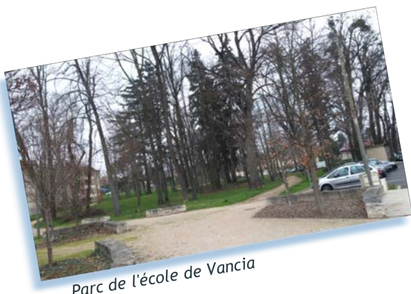
Parc de l'école de Vancia