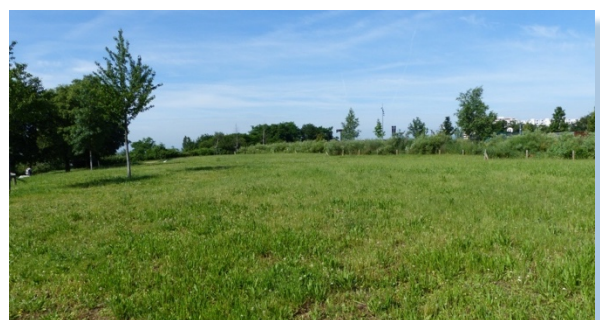
Parc des Horizons