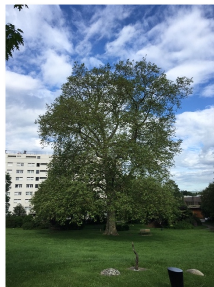
Platanus x acerifolia