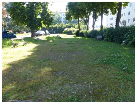
Parc de la Roue

L'ensemble de la zone a vocation à s'enherber si elle n'a pas d'usage spécifique. L'entretien est donc réalisé à la tondeuse ou à la débroussailleuse à dos. Il est important de maintenir une zone enherbée homogène dans laquelle les plantes érigées ne sont pas acceptées. On retrouve ces espaces principalement en code 3 et 4. Les codes 1 et 2 faisant l'objet d'un désherbage global.