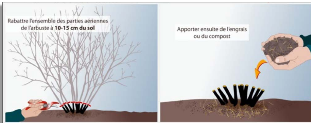
Recépage d'un arbuste

À l'aide d'un sécateur ou d'un coupe-branche, rabattez l'ensemble des parties aériennes