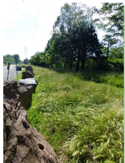
Longe des Lones