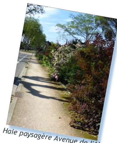
Haie paysagère Avenue de l'Ain