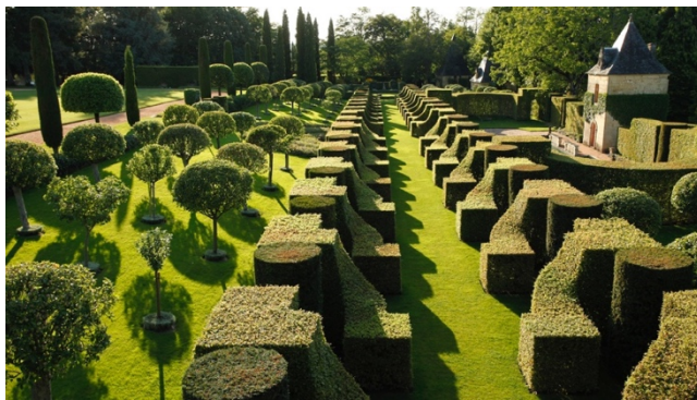
Illustration d'art topiaire