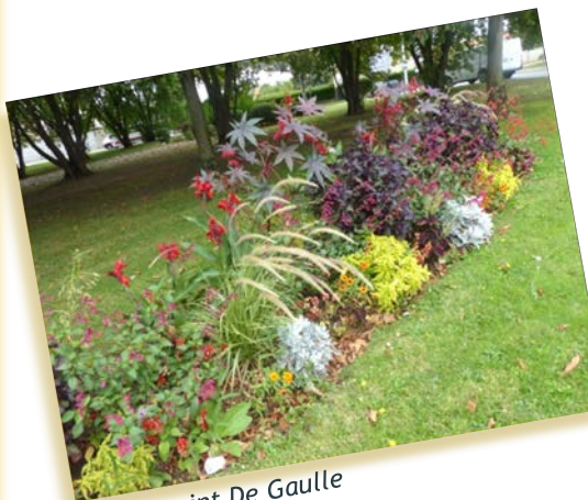
Rond-point De Gaulle