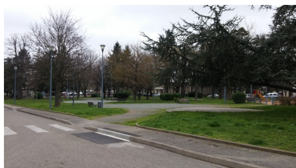
Parc de la Roue