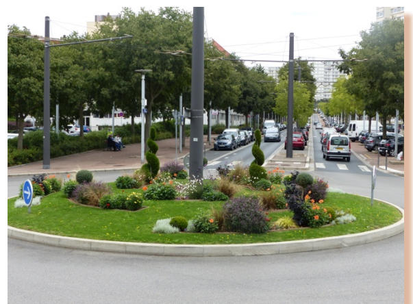
Rond-point AFN avec art topiaire

Les jardins concernés à Rillieux : Rond-point de Strasbourg, Rond-point de Verdun, Rond-point du Mont Blanc, Rond-point des Anciens Combattants d'Afrique du Nord, Avenue de l'Europe, les Eglises