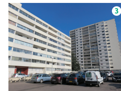
Logements actuels Avenue du Général Leclerc