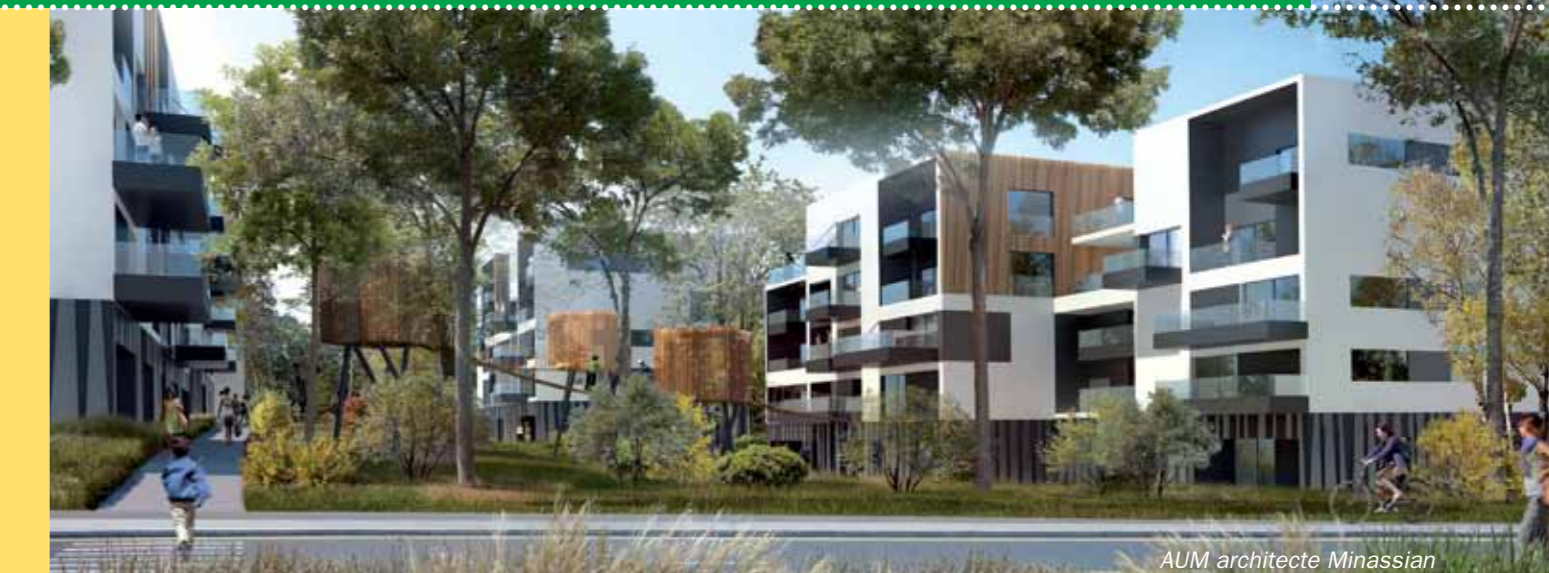
AUM architecte Minassian

Un projet ambitieux pour rénover et reconstruire à l'Est de la Ville nouvelle, pour accueillir de nouveaux logements, rénover des équipements et des espaces publics. Ce beau projet concerne à la fois l'actuel quartier de la Velette et le parc de Sermenaz.