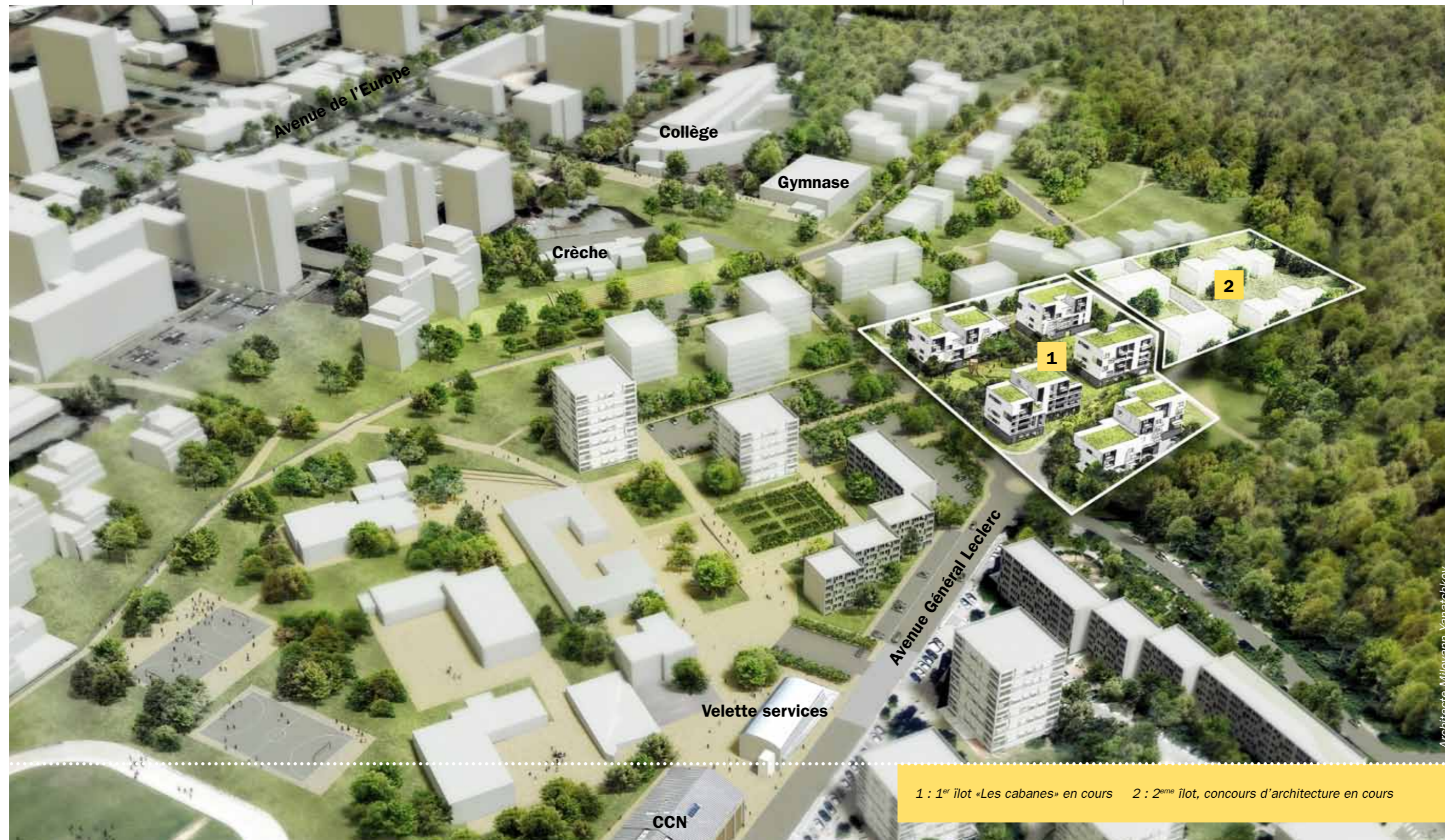
1 : 1 er îlot «Les cabanes» en cours 2 : 2 ème îlot, concours d'architecture en cours

Du bâti neuf et rénové permettra d'unifier l'ancien et le nouveau, de part et d'autre de l'avenue Général Leclerc.