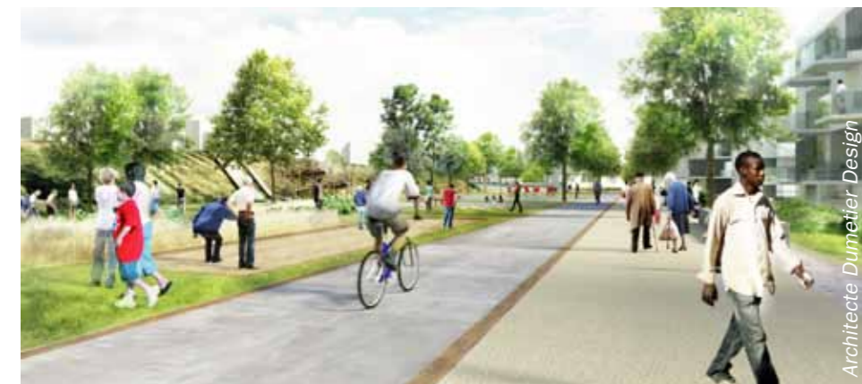
Une image de l'ambiance côté Velette...

Les bâtiments municipaux tels que le groupe scolaire Velette et la Maison pour tous seront repensés pour mieux répondre aux besoins.