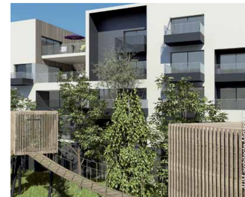
Une architecture contemporaine et chaleureuse, côté Balcons de Sermenaz...

500 places en sous-sol, réservées aux résidents 100 à 120 places, en surface, le long de la voirie Une aire de stationnement à l'entrée nord du parc.