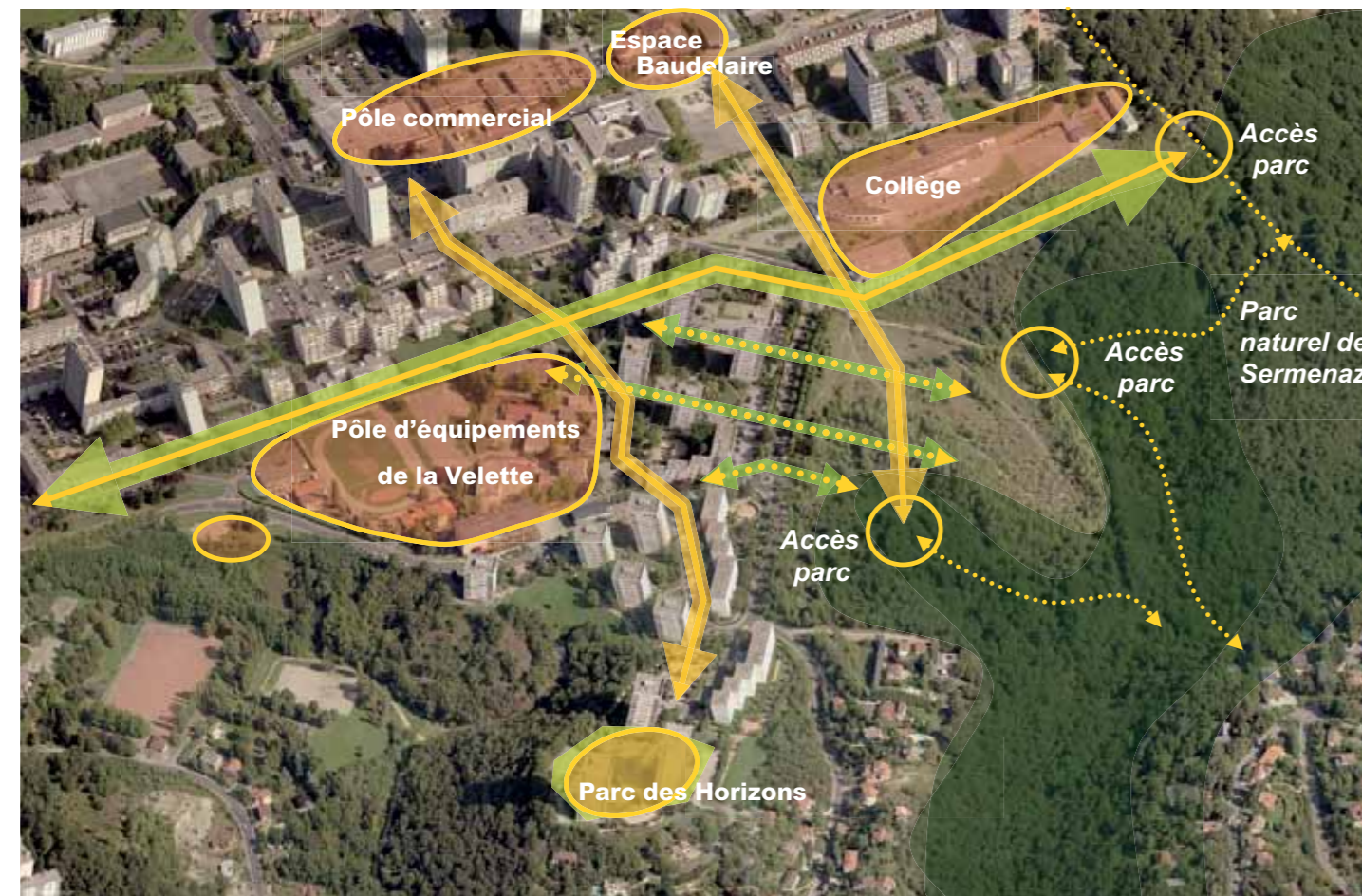
Carte des liaisons

Un traitement paysager de l'en-semble de ces liaisons, rappellera l'ambiance et l'image du Parc, dans un écrin de verdure.