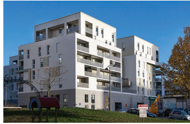
Résidence So New - Eiffage