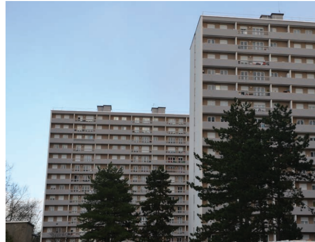
Réhabilitation des tours 3 et 5 rue du Bottet